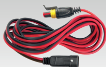
Prodloužovací kabel 2.5 m - 029057